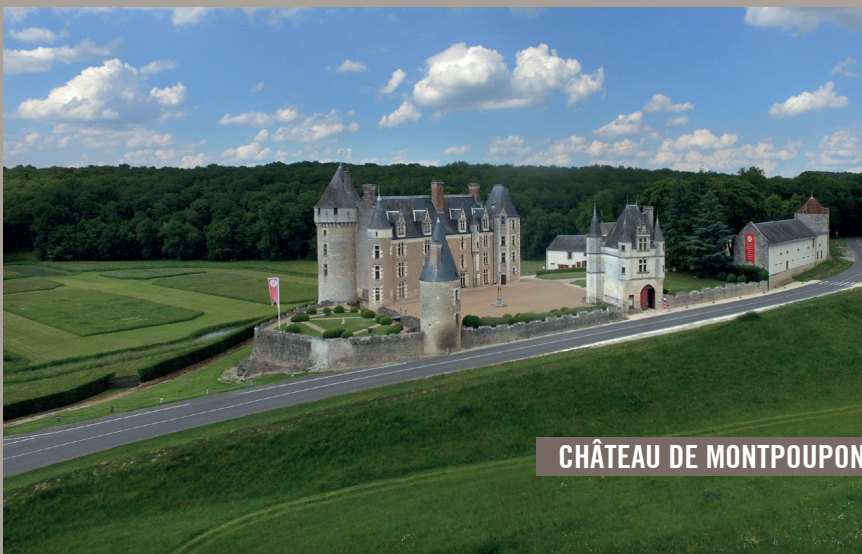
CHÂTEAU DE MONTPOUPON